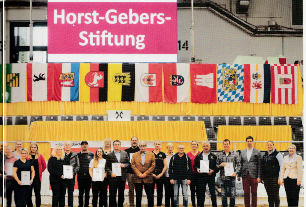
Ein großes Dankeschön für die Horst-Gebers-Stiftung: Die zehn Vereins-Vertreter freuen sich über die Urkunden zur Vereins-Förderung 2022.

hintereinander auf diesem Level. Somit hatten wir uns dieses Jahr bessere Starterfüllungen erhofft in